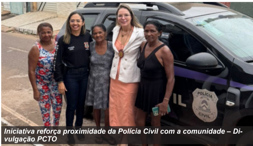
Iniciativa reforça proximidade da Polícia Civil com a comunidade

A Polícia Civil do Tocantins, por meio da 2ª Delegacia Especializada de Atendimento à Mulher e Vulneráveis (2ª DEAMV – Augustinópolis), realizou uma série de ações voltadas à proteção e ao acolhimento de pessoas idosas nos municípios de São Bento do Tocantins e Axixá do Tocantins. As atividades integram a Operação Virtude 2026, mobilização nacional coordenada pelo Ministério da Justiça e Segurança Pública (MJSP) e voltada ao enfrentamento da violência contra a pessoa idosa.