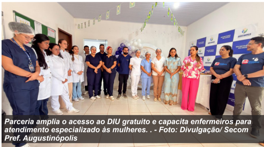
Parceria amplia o acesso ao DIU gratuito e capacita enfermeiros para atendimento especializado às mulheres.

Com a qualificação dos profissionais, o serviço de inserção de DIU passa a ser disponibilizado gratuitamente no município, fortalecendo a atenção à saúde da mulher e