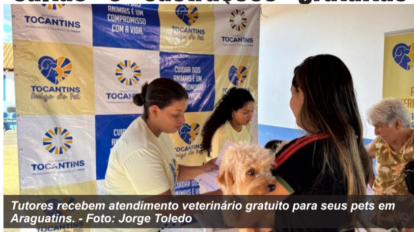
Tutores recebem atendimento veterinário gratuito para seus pets em Araguatins.

Para muitas famílias, os animais de estimação são parte fundamental do lar, trazendo alegria e companheirismo. No entanto, o custo financeiro com consultas, exames e procedimentos veterinários costuma pesar no orçamento e, muitas vezes, fica fora do alcance de quem mais precisa. Pensando em transformar essa realidade, o Governo do Estado promove, nos dias (20) e (21) de junho, a oitava edição do programa Tocantins Amigo do Pet no município de Araguatins, garantindo atendimento veterinário gratuito e de qualidade para a população local.